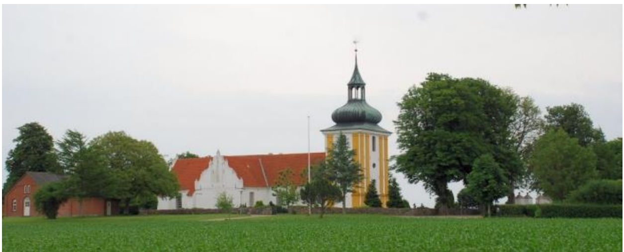
Husby kirke horte under Wedellsborg indtil 1990. Det er en korskirke, der har fungeret som begravelseskirke for Wedell-slægten siden 1600-tallet.